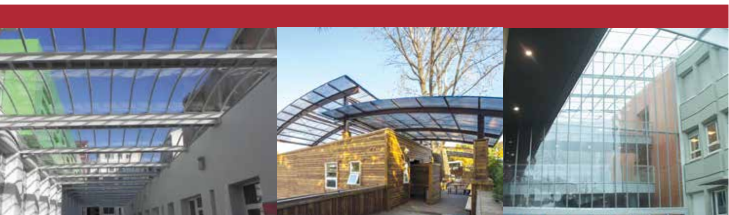
Colegio Zankoeta, España Danpal® Compacto Arquitecto: Mentxaka