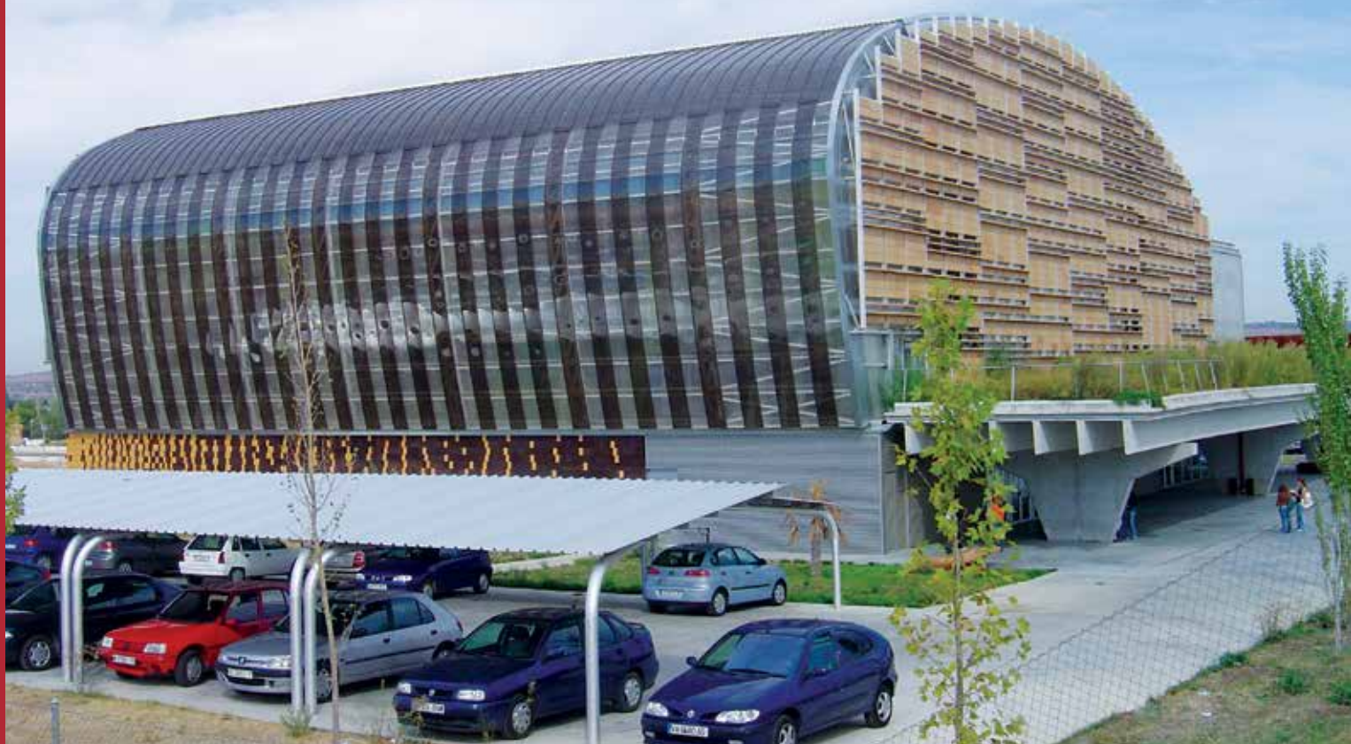
Edificio de Oficinas, España | Danpal® Compacto | Arquitecto: Pich Aguilera