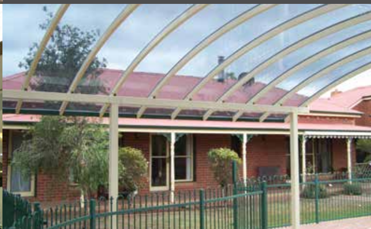
Residencial, Danpal® Compacto, Sydney Australia