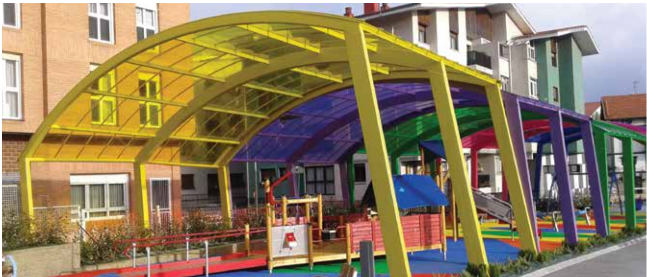
Parque de juegos, España | Danpal® Compacto | Arquitecto: Kepa Sacristan