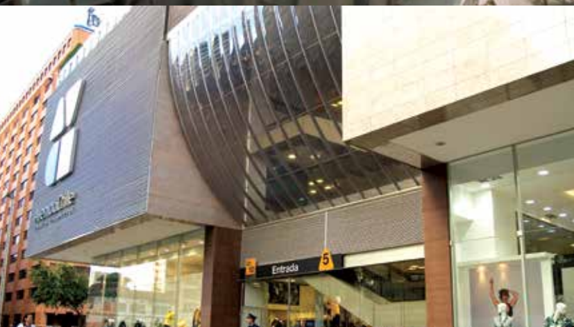
Centro Comercial Av Chile, Colombia | Danpal® Compacto